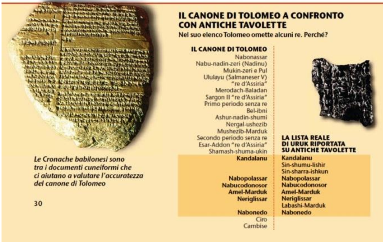
Tabella a p. 30 della WT 1/10/2011

La WTS mette a confronto la Lista Reale di Uruk con il Canone di Tolomeo, dove mancano alcuni nomi, cercando di far credere che la durata della dinastia babilonese calcolata da Tolomeo a partire da Kandalanu non sia corretta. Quello che però la WTS non dice è che la durata complessiva del dominio dei regnanti babilonesi riportata nella Lista Reale di Uruk è identica a quella di Tolomeo, come si nota nella seguente tabella: